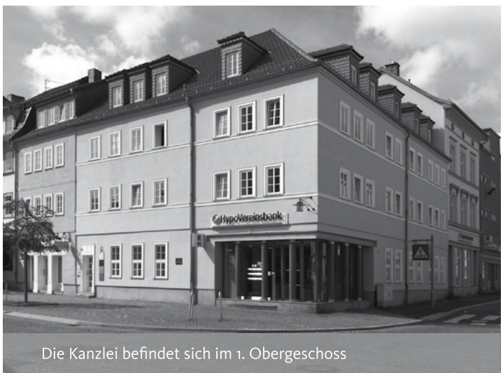
Die Kanzlei befindet sich im 1. Obergeschoss